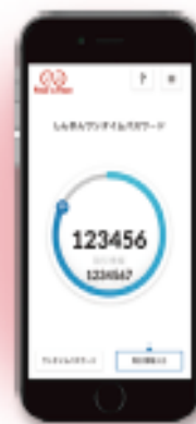
ソフトウェアトークン